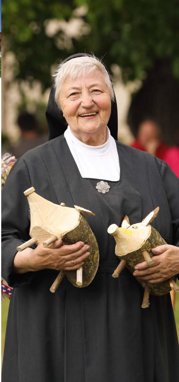
Hans Steindl Erster Bürgermeister